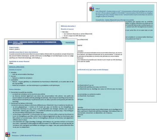
Figure 5 : Aperçu d'une fiche méthodologique (Tome II – p.11-p.16)