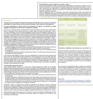
Figure 9 : Aperçu d'une étude de cas d'une méthodologie « bottom-up » (Tome I – p.27-p.36)

Dans le tome III, vous trouverez une description détaillée de la méthodologie top-down : les règles et conventions selon une approche par « scope » et une approche par « enjeu » ; les conditions de mise en œuvre de la méthode ; et des recommandations méthodologiques permettant d'interpréter les résultats et leurs évolutions, en tenant compte des avantages et limites de la méthode. Un tableau Excel téléchargeable en complément de ce guide contient des facteurs d'émissions moyens, en kg CO 2 e par € d'actif financier, par secteurs d'activité et par zones géographiques (cf. exemple figure 9).